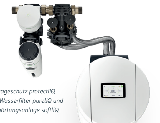
Leckageschutz protectliQ mit Wasserfilter pureliQ und Enthärtungsanlage softliQ

Befindet sich an Ihrer Enthärtungsanlage softliQ ein kabelgebundener Wassersensor? Dann kann dieser mit dem protectliQ verknüpft und der Aufstellort Ihrer Anlage überwacht werden.