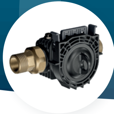
cliQlock-Basismodul mit Verschlusskappe