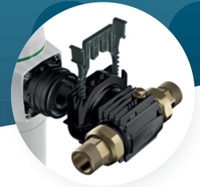
cliQlock-Anschluss pureliQ X-Baureihe