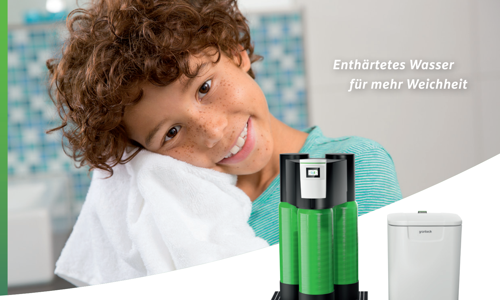
Enthärtungsanlage softliQ:LB mit optionaler Austauscherisolierung