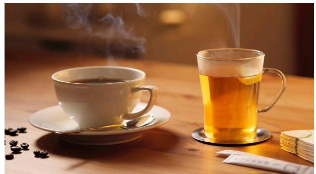
Weiches Wasser sorgt bei Kaffee und Tee für mehr Genuss.

Für diese Fälle empfehlen er und Grünbeck das Modell „softliQ:SD21“ als am besten passende Anlage. Installiert wird sie am Hauswassereingang, direkt nach dem Grünbeck- Feinfilter pureliQ, der seinerseits dafür sorgt, dass selbst kleine Feststoffpartikel wie Rostteilchen oder Sandkörner ausgefiltert werden. Die Enthärtungsanlage softliQ:SD reduziert im Anschluss den Härtegrad der kompletten Trinkwasserinstallation auf voreingestellte 5 °dH. Ein idealer Härtegrad für alles, was im Haus mit Wasser in Berührung kommt.